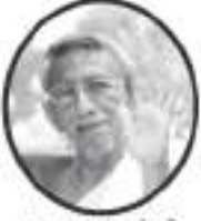
અદ્યાત્મ સોગી આ.દે. શ્રીમદ્ વિજય કલાપૂર્ણસુરિચારણ મ.સા.